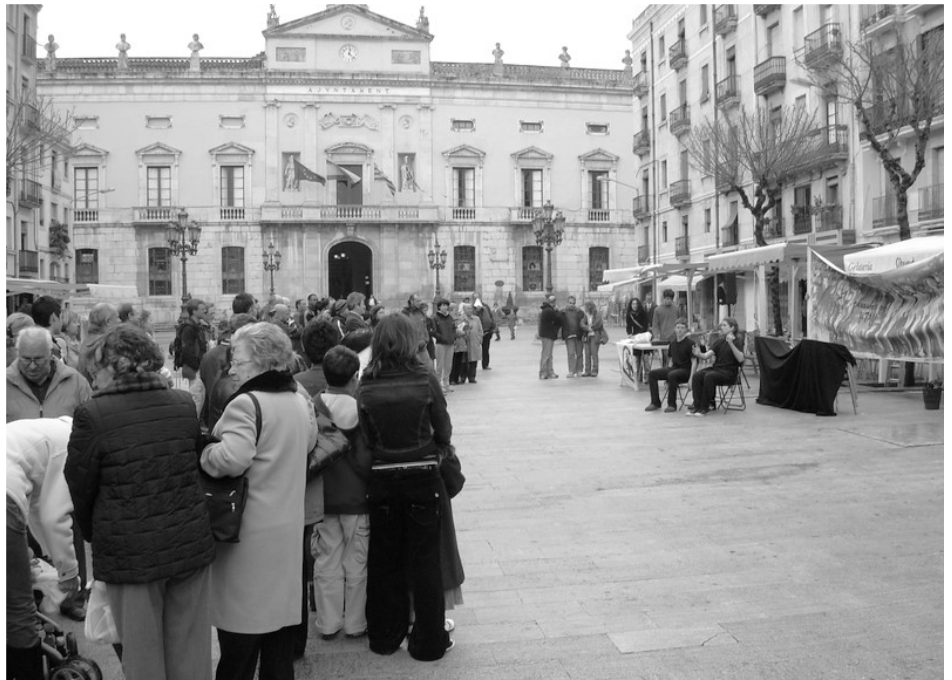
una de les concentracions de cada primer diumenge de mes

Els avenços són lents, però amb temps la Coordinadora s'ha convertit en un referent del moviment per la pau i l'anti-