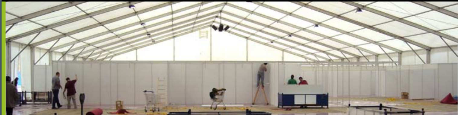
Instal·lació de la carpa.