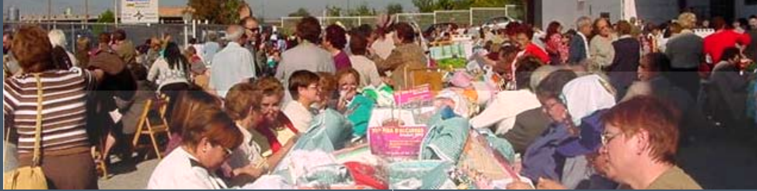
Activitats celebrades durant els dies de la fira.