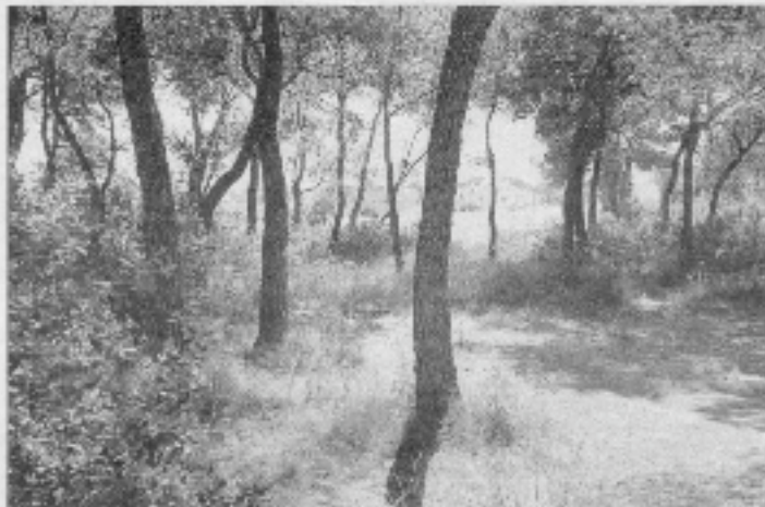
El bosque del Jallvert de Santa Oliva es el único que queda en el núcleo urbano.