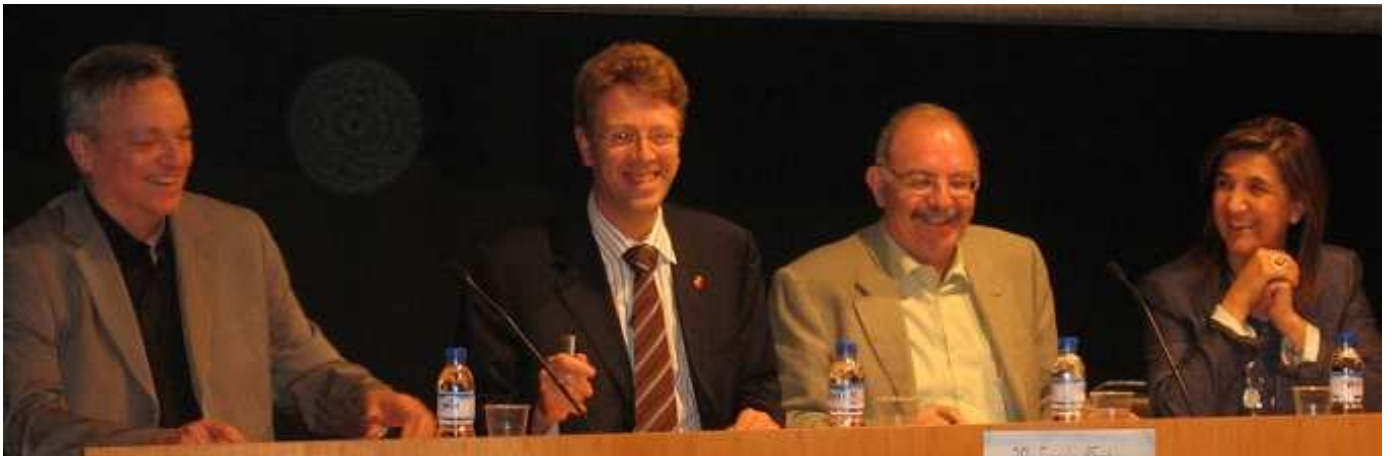
ACTE INAUGURAL DE LA 29ª ESCOLA D'ESTIU DE LES TERRES DE L'EBRE