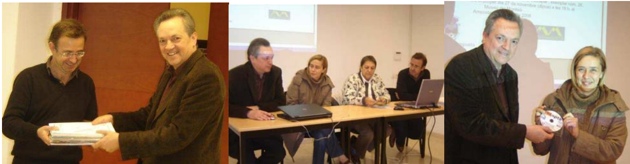
ENTREGA DE L'ARXIU DIGITAL i col·lecció "Recapte" al Museu del Montsià - ESCOLA D'ESTIU 2008-