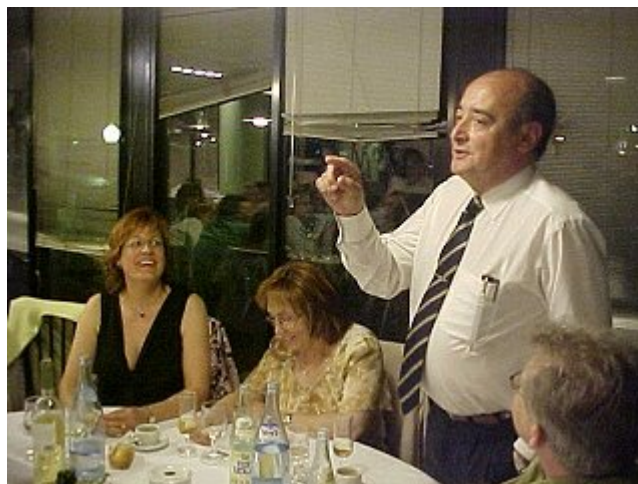
Sopar commemoratiu dels 25 anys de l'Escola d'Estiu de les Terres de l'Ebre