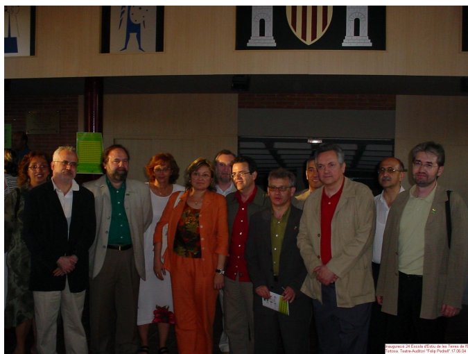
Acte d'inauguració de la 24a Escola d'Estiu presidit per l'Hble. Consellera d'Educació