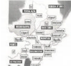
CEIP SANT JAUME / SANT JAUME D'ENVEJA