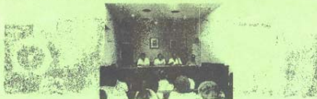
(Presentació del llibre Ulldecona al saló de plens de l'ajuntament d'aquesta població)