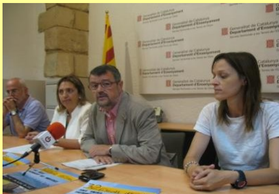
EL DIRECTOR DELS SSTT D'EDUCACIÓ A LES TERRES DE L'EBRE: