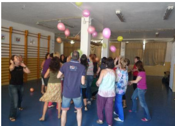
GESTIÓ DE LES EMOCIONS I FUNCIÓ TUTORIAL