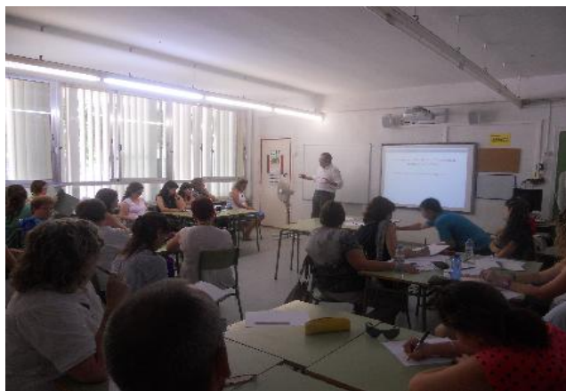
FONAMENTS DE MILLORA DE DIDÀCTICA DE L'ESCRIBURE