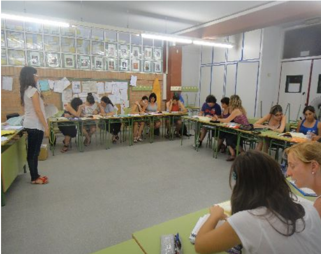
CURS LITERATURA ORAL TORTOSA