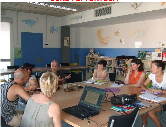
CURS COEDUCACIÓ AMPOSTA