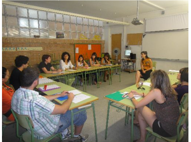
CURS RELACIÓ DOCENT-DICENT TORTOSA