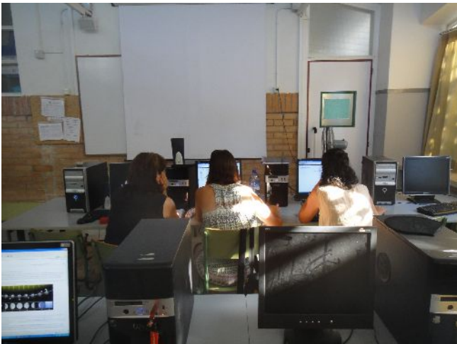
CURS PDI TORTOSA