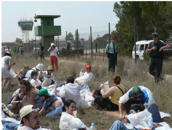
una "tombada" davant la porta de la base

Davant la tanca, al costat de la pista d'helicòpters de la base, els i les integrants de la marxa van penjar alguns dels cartells que van ser, ràpidament, retirats pels agents, com si fos una metàfora de la incompatibilitat entre bases militars i llibertat d'expressió. Pocs metres després es produí la infiltració d'una desena d'inspectors civils que, sortejant els durs placatges dels antidisturbis de la Guàrdia Civil, van aconseguir colar-se entre el filferro i trepitjar el terreny