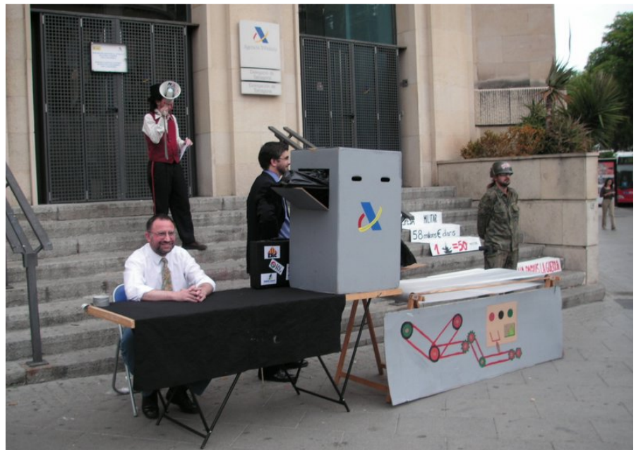
el show dels pressupostos o com convertir diners en armes

Un funcionari anava recollint els diners dels impostos que diferents persones lliuraven a Hisenda i els introduïa a la maquinària dels pressupostos generals, en mans dels polítics. A l'altra extrem de la maquinària, un militar recollia els míssils, tancs o vaixells de guerra en què els diners s'havien convertit.