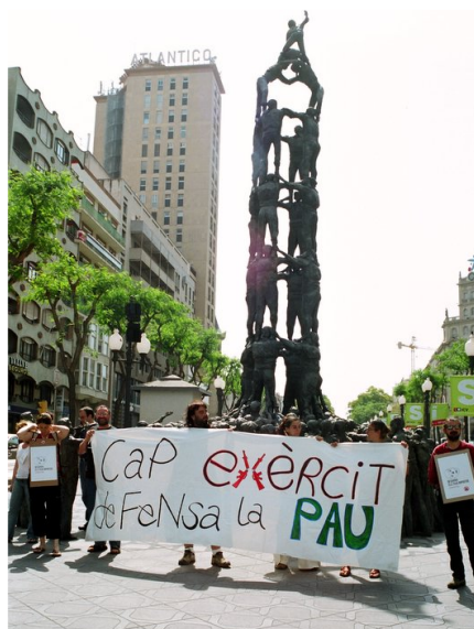
la campanya és solidària, activa, pública, col·lectiva...

Com la delegació d'Hisenda era tancada vam anar passejant fins la subdelegació de govern on vam lliurar, en el registre general les instàncies adreçades al Sr. Ministro de Hacienda, en què manifestem el nostre rebuig a finançar la despesa militar (per exemple els 369,73 milions d'euros gastat a l'invasió d'Iraq fins el replegament de les tropes).