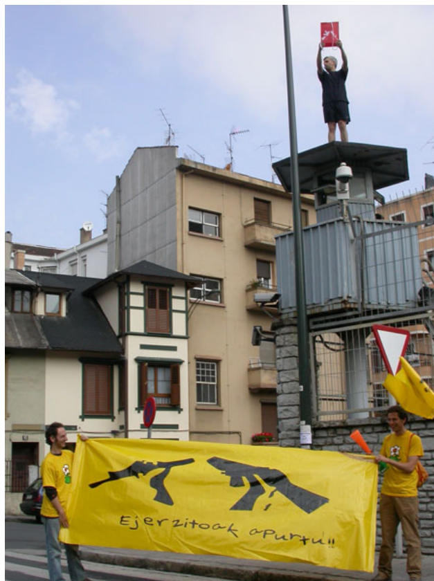
la societat treu la targeta vermella a l'exèrcit

Como se venía anunciando, el sábado, 17 de junio, a las 11 h. ha tenido lugar el esperado partido de los mundiales entre