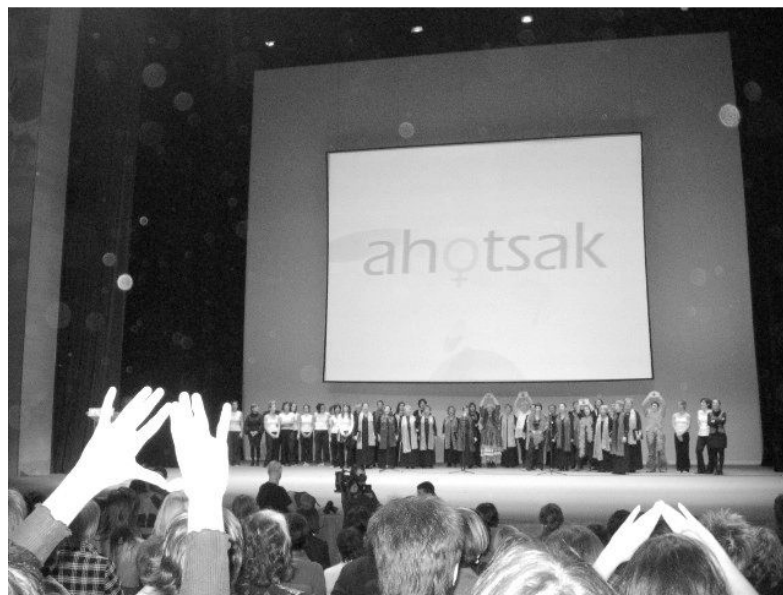
Un moment de l'acte celebrat a l'Euskalduna

http://www.aotshak.org ) centrat en tres idees: