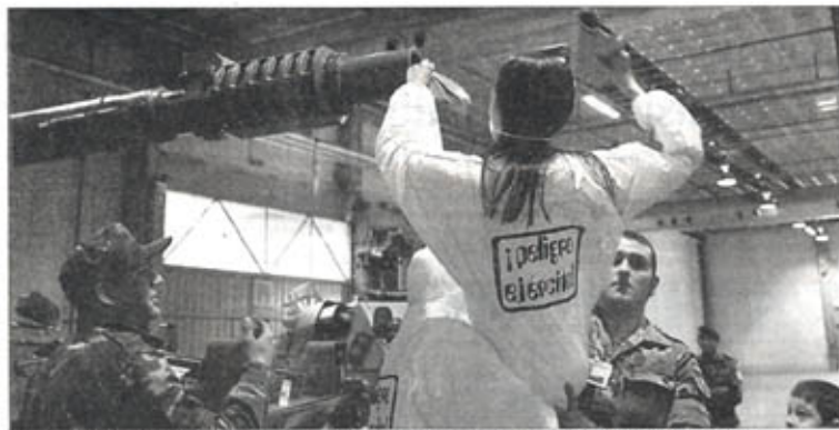
soldats impedit que un antimilitarista tapi el canó d'un tanc

En els fullets d'informació s'advertia als assistents que la zona estava "altament conta-