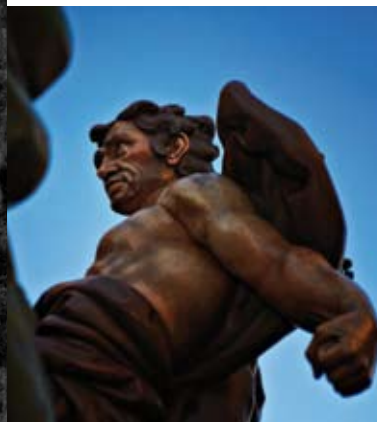
TARRACOIMATGE ❖❖❖ LA FLAGEL·LACIÓ