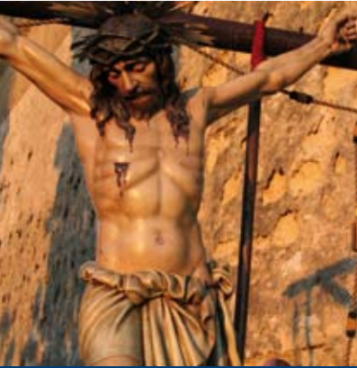
ORIOI VENTURA ❖ SANT CRIST DE LA SANG