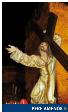
PERE AMENÓS ❧