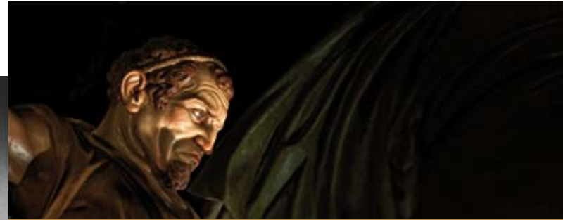
TARRACOIMATGE ❖❖ EL CIRINEU

C. Cambrils, 12-14 Tel.: 977 77 19 54 Reus www.asbusquets.bmw.es