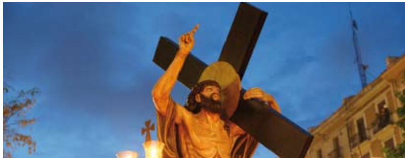
CARLES MALLOL ■ JESÚS DE LA PASIÓN

A las 6.15 h saldrán de la iglesia de Nazaret el Santo Cristo de la Sangre, acompañado de congregantes y representantes de las cofradías tarraconenses con las túnicas y los capuces, para dirigirse a la Catedral, donde se iniciará el VÍA CRUCIS PROCESIONAL por la Parte Alta, que acabará en la plaza del Rei. Organiza: REAL Y VENERABLE. CONGREGACIÓN DE LA PURÍSIMA SANGRE.