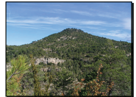
Panoràmica del Puig de Gallicant

Grau del Bosc del Joanet on hi ha un pal indicador i una esplèndida panoràmica del Puig de Gallicant. Seguim la traça del sender poc definida a trams i en tres minuts més, saltem els avenquets, albirant des de la plataforma de roca els cingles del riu. Seguint el sender