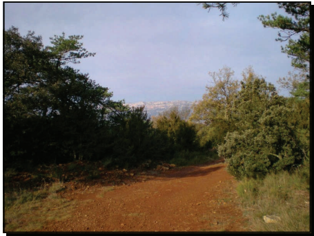
Carrerada reial pel Bosc de la Ció

Venint en cotxe de Reus cap Arbolí i passat el pont sobre el riu, podem aparcar als voltants de la font del rentador, entrar al poble i començar l'excursió. Al front mateix del pont, hi ha el carrer del Trinquet, per on pugem seguint per la dreta el carrer de Sant Pau. Sortim del poble seguint el GR-7 (blanc i roig) i el PR C-88 (blanc i groc) durant uns dos-cents metres, havent deixat a l'esquerra la bifurcació que puja a l'ermita de Sant Pau. En aquest punt, el camí gira a l'esquerra pujant. Nosaltres agafem la bifurcació de la dreta, creuant a gual el riu d'Arbolí i trobant a l'esquerra entre roques i prop de la llera, la font Viva. Seguim pujant pel senderó que passa pel costat d'una tanca del càmping i salta a la pista principal que seguim