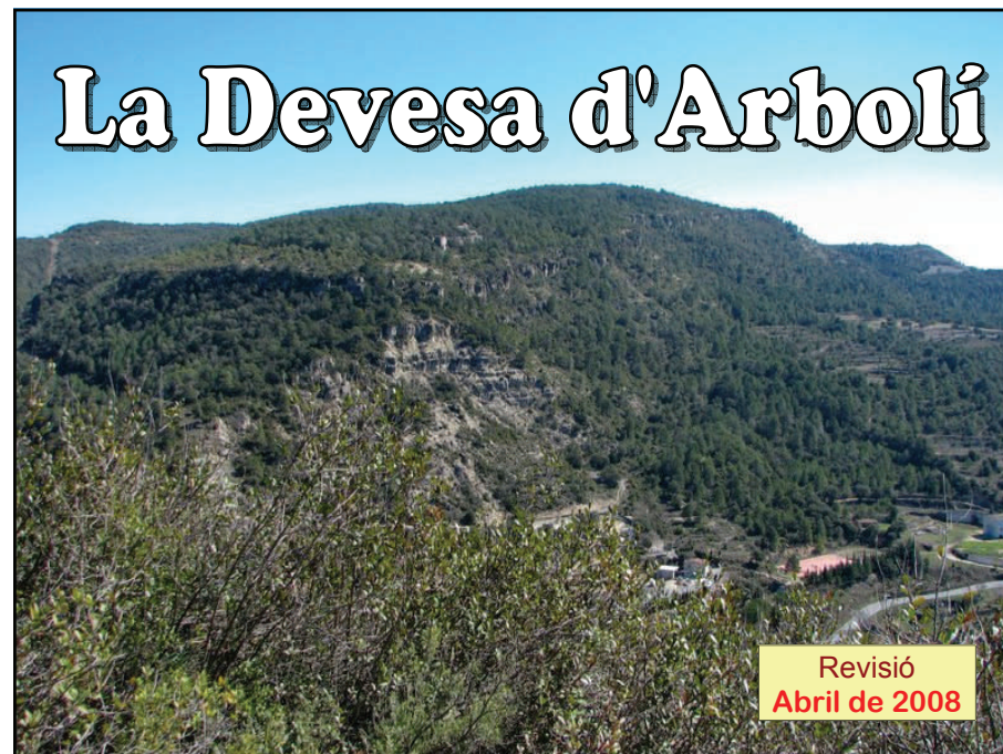
VISTA DE LA DEvesa DES DE SANT PAU

Traçat bastit per la Secció Excursionista del Reus Deportiu amb motiu del 40è Dia del Camí de Muntanya de la Regió IV Mapa Comarcal de Catalunya 1:50.000 (ICC) Traçat cartogràfic amb GPS i fotos: Josep Salafranca