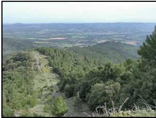
La Serra Alta i la Conca de Barberà

que hem arribat al coll, per l'esquerra hi ha la pista que hem de seguir, deixant el GR que puja per una senda a la dreta al cap d'uns cent metres. Seguim la pista per un bosc feréstec durant prop d'uns dos quilòmetres des del Coll, arribant al Clot del Llop on tenim un sòlid i artístic pal indicador amb una capelleta de la Mare de Déu de Misericòrdia. Segons