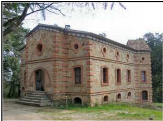
La casa forestal del Tillar

Iniciem l'excursió a la bàscula on comença el camí de les Forquetes, pista ampla a l'esquerra marcada amb senyals de PR. Als aproximadament deu minuts som al coll del mateix nom i un quilòmetre després trobem una bifurcació a l'esquerra. Seguim rectes per la ampla pista fins arribar a una cruïlla que seguim per la dreta i assolir el coll del Bosc on trobarem per la nostra dreta el camí del Colomer (GR-171) que puja al Tossal per una senda a pocs metres del coll i a la nostra esquerra, assenyalat per un pal indicador, el PR-86 que baixa pel Barranc del Tillar. Al front, la pista continua cap a la mina de l'Obis, que queda a la nostra dreta amb la seua font a tres minuts del coll. Seguim pujant i als 200 m des de la font, trobem un pal indicador que ens indica la direcció al Tossal de la Baltasana i la de la Cova del Pere.