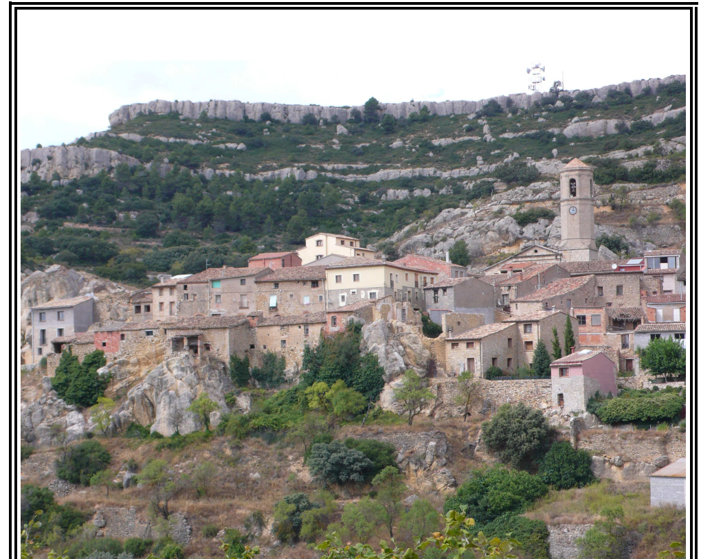
Vilanova de Prades, al peu de la serra la Llena