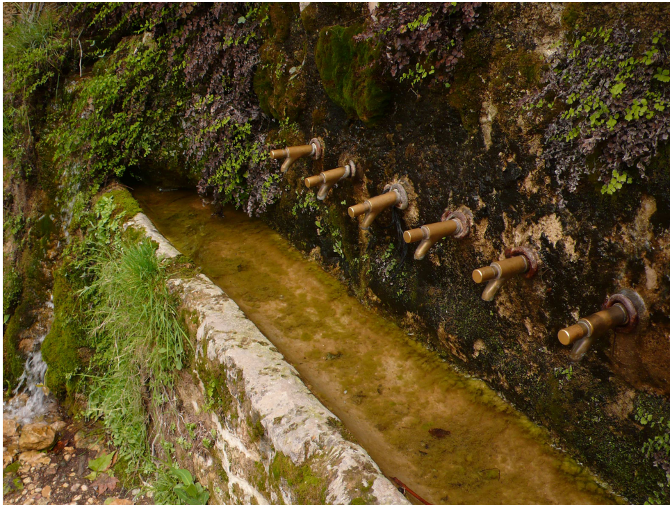
La font de l'ermita de Sant Miquel de la Tosca