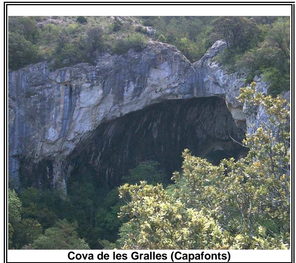
Cova de les Gralles (Capafonts)