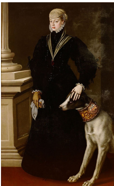
El retrato con el perro 1557

Parece ser que el primero en señalar a la princesa como candidata a suplir a Felipe II en el gobierno peninsular fue el propio embajador español en Lisboa, Luis Sarmiento, buen conocedor de la situación en la que había quedado ésta y que sólo veinte días después de enviudar le aconsejaba que regresara a Castilla y se encargara de la regencia del reino. Puede que en un principio la idea fuera acogida con recelo por parte del Emperador que veía en su hija esa altivez e independencia que podrían poner en entredicho su autoridad. Fue la propia María de Hungría su tía y su hermano Felipe quienes apoyaron su candidatura y así, en marzo el Emperador otorgaba desde Bruselas los poderes al tiempo que avisaba a Felipe de que “miréis mucho las personas que poneys cerca de la suya en los Consejos” . Por su parte el príncipe le dejaba amplias instrucciones sobre el modo en que debía gobernar y sólo a última hora decidió restringir sus poderes.