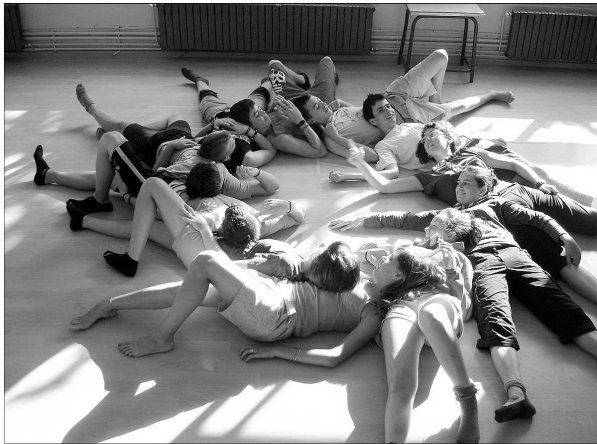
Imagen actual de una de las actividades del Agrupament Escolta i Guia Montsant-Cim.

Desde la década de los 80 hasta la época actual, el agrupamiento, al igual que otros que son miembros de la Coordinadora d'Esplais