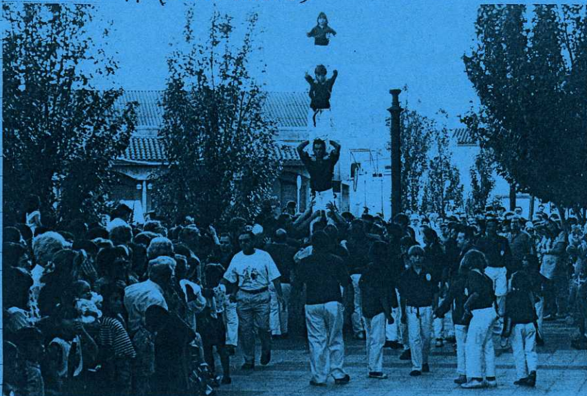
ST. PERE - 94