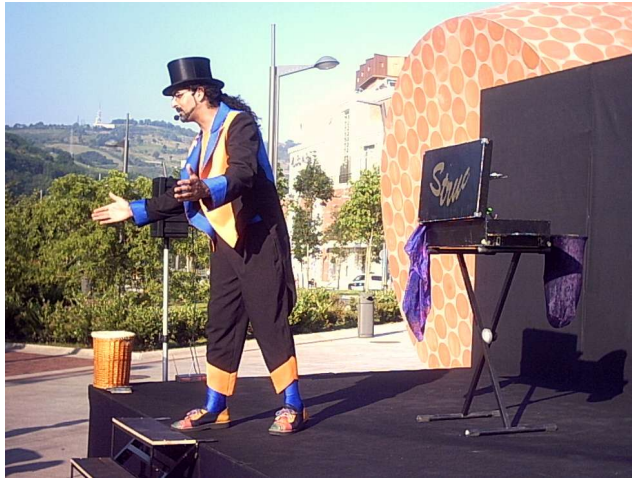
Itsasadar Magikoa - Bilbao -

Jocs visuals: els dos jocs que segueixen tenen la mateixa dinàmica de desenvolupament; es tracta d'enganyar la vista fent creure que les coses estan en un lloc quan realment són en un altre. El joc de la flor i el del reciclatge del vidre fan que els espectadors aguditzin els seus sentits inconscientment.