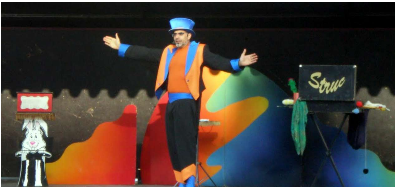
Tamarite de Litera - 2010 -

S'utilitzen tècniques de màgia còmica, cartomàgia, mentalisme, manipulació d'objectes, escapisme, improvisació assajada, globoflèxia, màgia amb animals, humorisme i caricaturització. La combinació d'aquestes tècniques precises i específiques amb la simplicitat, dona com a resultat un espectacle simpàtic i sorprenent.