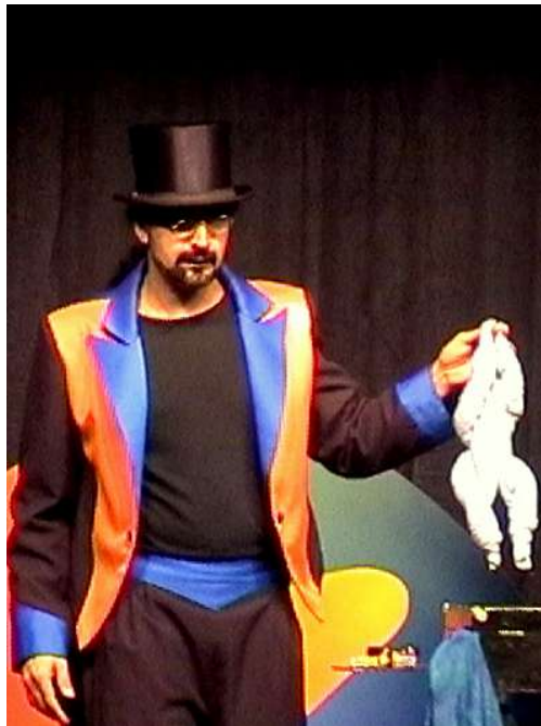
Teatre Bravium - Reus -

Transformació d'objectes: Un objecte és el que és mentre no es manipula. En el moment en què el podem doblegar, arrugar, enrotllar, etc. podem fer que sembli un altra cosa. Així doncs, utilitzant les tècniques de la màgia còmica, en el següent joc, la nostra senzilla tovallola, una vegada manipulada, esdevindrà un formós pollastre a l'ast.