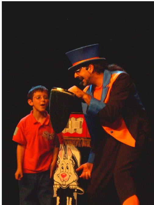
Tamarite de Litera

Jocs visuals: els dos jocs que segueixen tenen la mateixa dinàmica de desenvolupament; es tracta d'enganyar la vista fent creure que les coses estan en un lloc quan realment són en un altre. El joc de la flor i el del reciclatge del vidre fan que els espectadors aguditzin els seus sentits inconscientment.