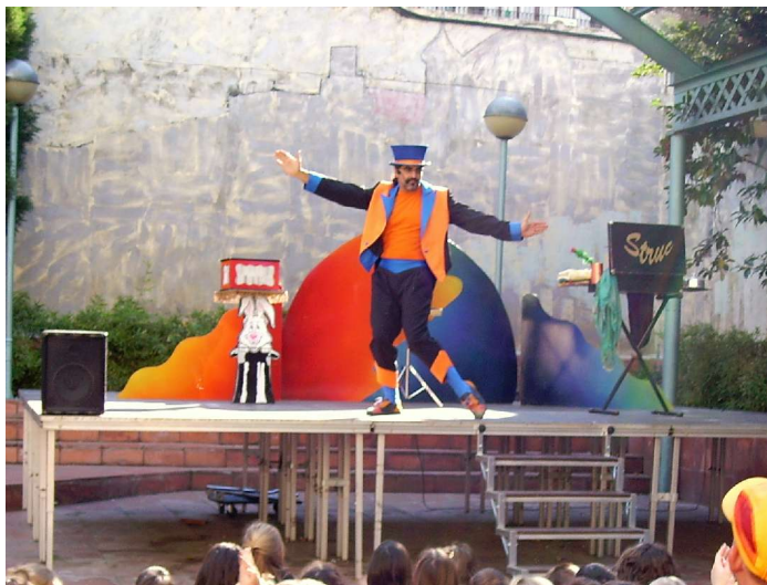
Centre Cultural La Casa Elizalde Bcn

El nostre actor, carismàtic i simpàtic, demana constantment la participació del públic. A l'escenari és el fil conductor entre els diferents objectes, molts dels quals formen part de la nostra vida quotidiana, el públic i la màgia. Així, gràcies als voluntaris, escollits a l'atzar entre els espectadors, s'accentua el vessant còmic de l'espectacle i, en situacions improvisades, es realitzen els diferents trucs de màgia.