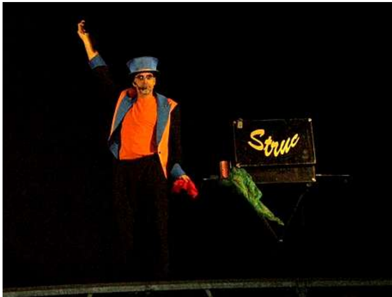
Rambla Nova - Tarragona - 2009

Tot en el nostre espectacle està pensat per desenvolupar les nostres capacitats; aconseguir captar l'atenció d'un públic infantil, tot divertint els adults, és la finalitat d'aquest espectacle, que amb un ritme accelerat i molta acció ens introduirà al món de la màgia.