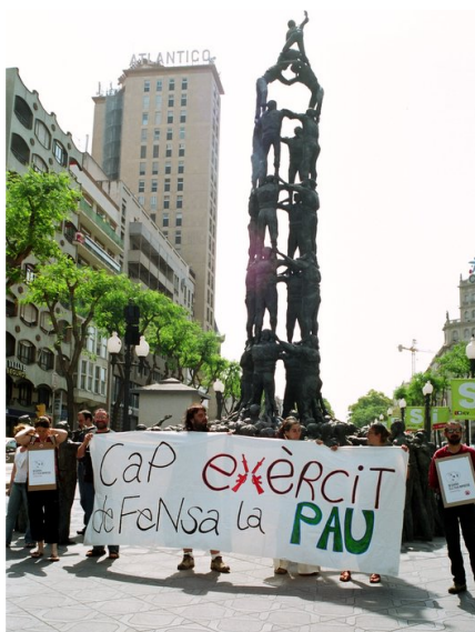
la campanya és solidària, activa, pública, col·lectiva...

Com la delegació d'Hisenda era tancada vam anar passejant fins la subdelegació de govern on vam lliurar, en el registre general les instàncies adreçades al Sr. Ministro de Hacienda, en què manifestem el nostre rebuig a finançar la despesa militar (per exemple els 369,73 milions d'euros gastat a l'invasió d'Iraq fins el replegament de les tropes).