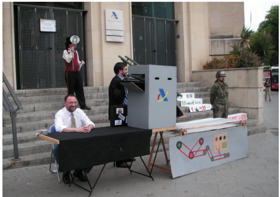
el show dels pressupostos o com convertir diners en armes

Un funcionari anava recollint els diners dels impostos que diferents persones lliuraven a Hisenda i els introduïa a la maquinària dels pressupostos generals, en mans dels polítics. A l'altra extrem de la maquinària, un militar recollia els míssils, tancs o vaixells de guerra en què els diners s'havien convertit.