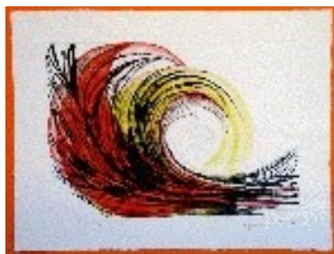
Giravolt Tècnica: Gravats additiu. 57 x 38 cm.