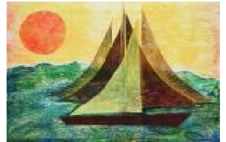
Forejar Tècnica: Gravats additiu / linogravat /Collage. 112 x 76 cm.