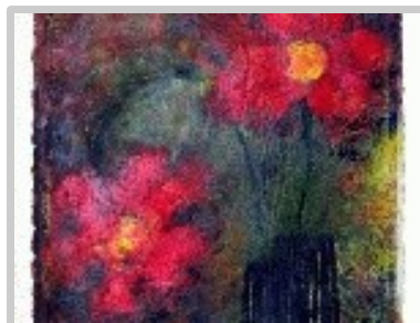
Flascó de flors