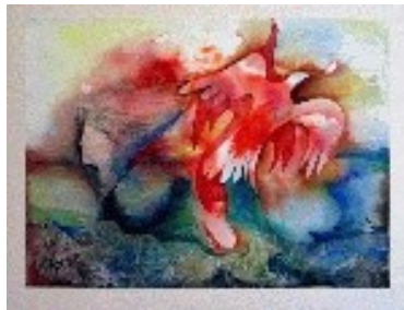
Observant Tècnica: Monotip. 65 x 50 cm.