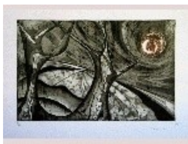
Tardor Tècnica: Gravats calcogràfic. 50 x 31cm.