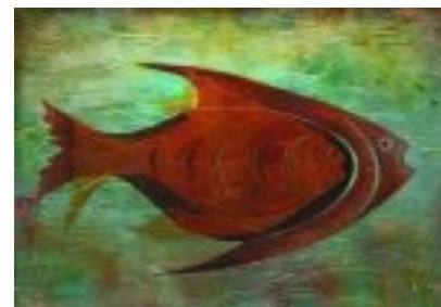
Al fons del mar Tècnica: Gravats additiu / linogravat. 76 x 56 cm.