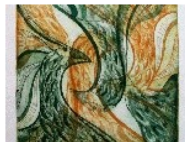
Ocells al vol Tècnica: Gravats calcogràfic. 35 x50 cm. Paper fet a mà.