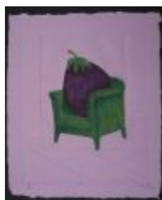
El repòs de l'albergínia Tècnica: Gravats calcogràfic /gofrat. 24 x 18 cm. Paper fet a mà.