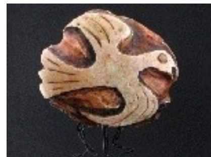
Ocell de pau