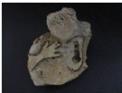
Els cinc sentits i la Natura