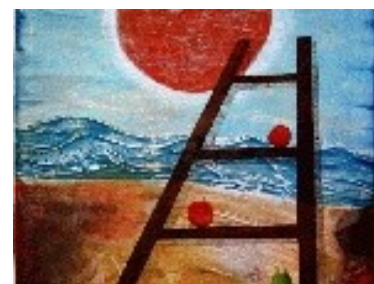
Al·legoria a la Mediterrània Tècnica: Gravats additiu / linogravat / carborundum amb translació. 75 x 60 cm.