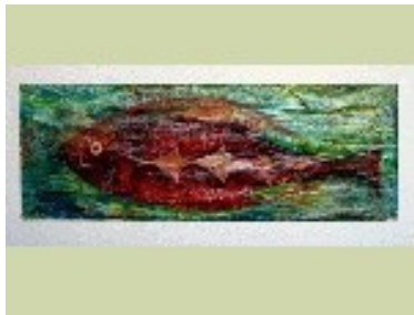
Peix vermell Tècnica: Gravats additiu / collage / linogravat. 85 x 30 cm.