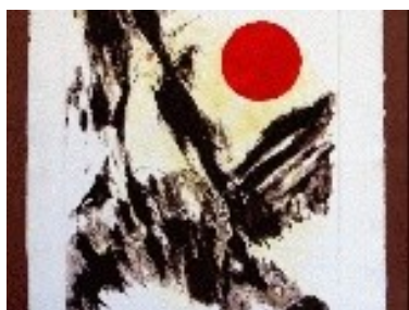
Ocell de pau Tècnica: Gravats calcogràfic. 15 x 15 cm.