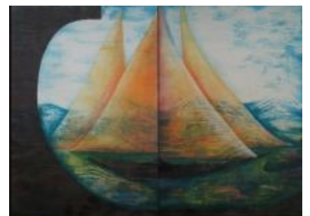
Navegant (Díptic) Tècnica: Gravats additiu / linogravat. 65 x 43 cm. / 65 x 43 cm.