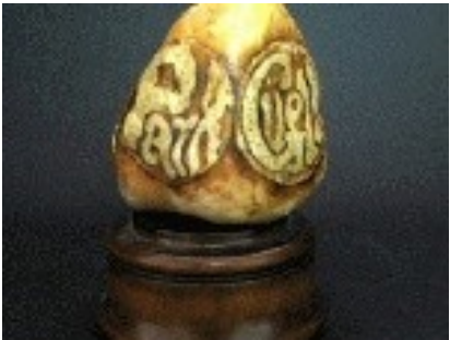
Homenatge a Gaudí Pedra / Fusta