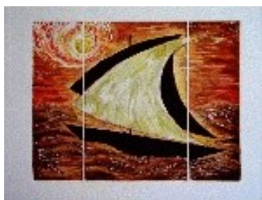
Navegant per la Mediterrània (tríptic) Tècnica: Gravats calcogràfic /gofrat. 50 x 35 cm.