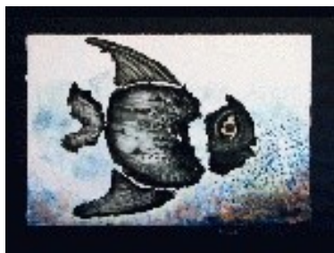
Fòssil Tècnica: Gravats calcogràfic / monotip. 57 x 38 cm.