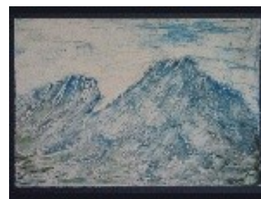
Onades Tècnica: Gravats additiu. 72 x 56 cm.