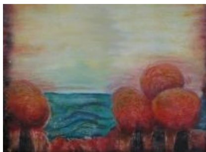
La Mediterrània (Díptic) Tècnica: Gravats additiu. 60 x 40 cm. / 60 x 40 cm.