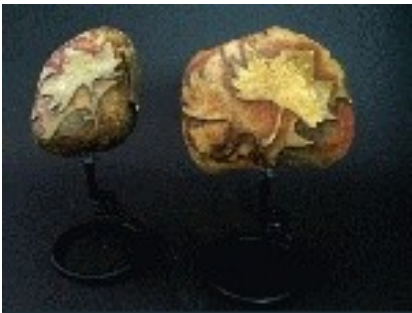
Conjunt Pedra / Ferro