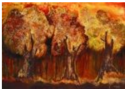
Entretemps Tècnica: Gravats additiu. 100 x 70 cm.