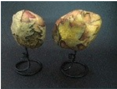
Conjunt Pedra / Ferro