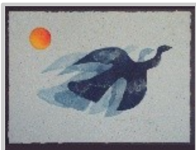
Ocell al vol