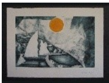
Un dia de pesca Tècnica: Gravats calcogràfic. 50 x 32 cm.