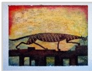
Gat fent el seu camí