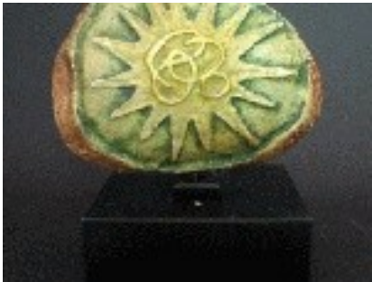
Homenatge a Gaudí II Pedra / Fusta