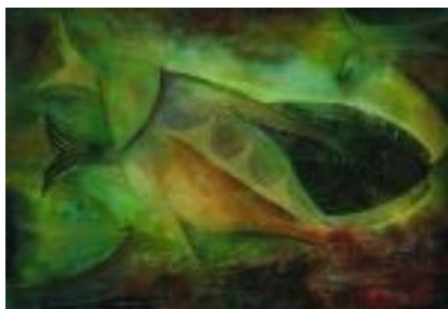
Peixos fent el seu camí Tècnica: Linogravat / monotip. 112 x 76 cm.