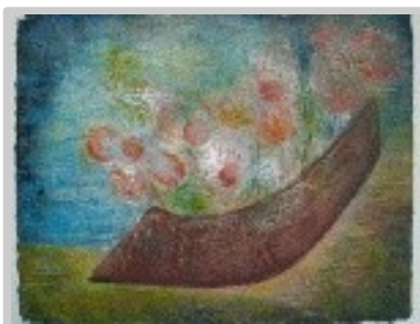
Cistell de flors

Tècnica: Gravata additiu /collage /monotip.