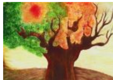
Les estacions Tècnica: Gravats additiu. 88 x 63 cm.