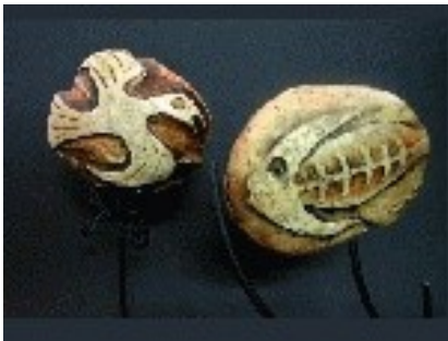
Conjunt Pedra / Ferro