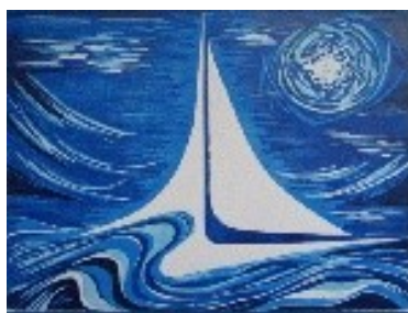
Mar endins Tècnica: Xilografia. (Planxa perduda) 72 x 56 cm.