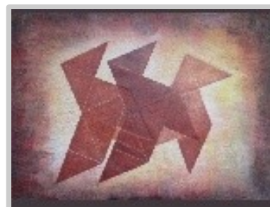
Ocells de paper

Tècnica: Xilografia /monotip amb translació.