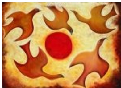
Ocells que giren al voltant del Sol Tècnica: Gravats urbà. 100 x 76 cm.