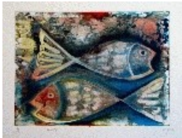
Bessons Tècnica: Monotip. 35 x 26 cm.