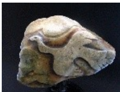
Ocell de pau II