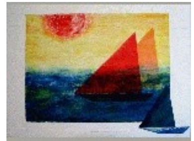
Homenatge a Glòria Josa. In memoriam Tècnica: Gravats additiu/ collage (papiroflèxia). 100 x 76 cm.