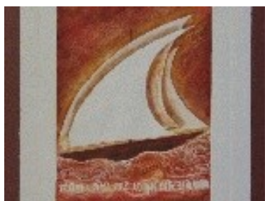
Navegant per la Mediterrània Tècnica: Gravats calcogràfic /gofrat. 25 x 35 cm.