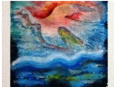
Ocell de pau Tècnica: Monotip /Collage /Translació. 25 x 20 cm.