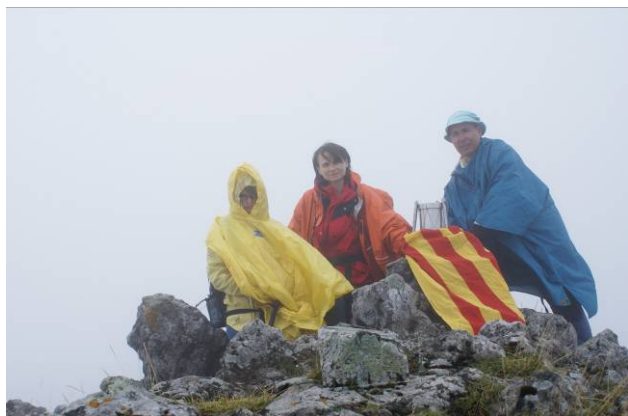
Aitxurri 1.551 m. (GUIPÚZCOA – GUIPUZKOA)

Tot el recorregut ens va costar unes cinc hores de caminar reals.