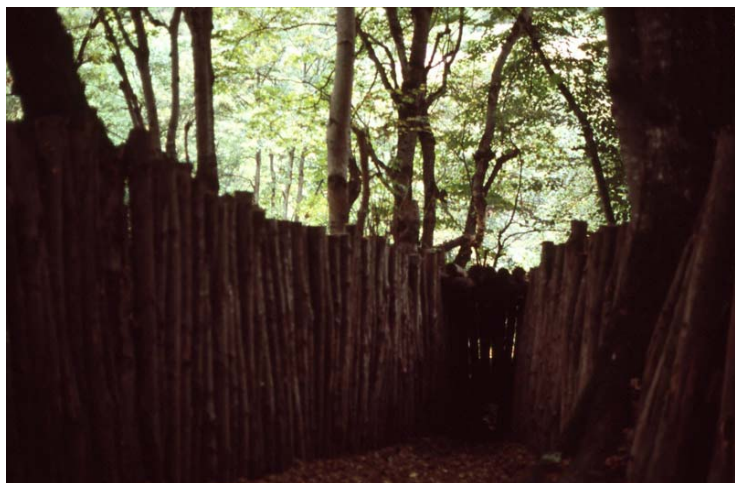
El Chorco de los lobos

Durant el segle VIIIè el poder i la influència d'aquest monestir va augmentar degut fonamentalment a la vinguda de molts refugiats de la invasió àrab. D'aquella època, any 776, daten el comentaris Apocalíptics del famós Beato de Liébana.