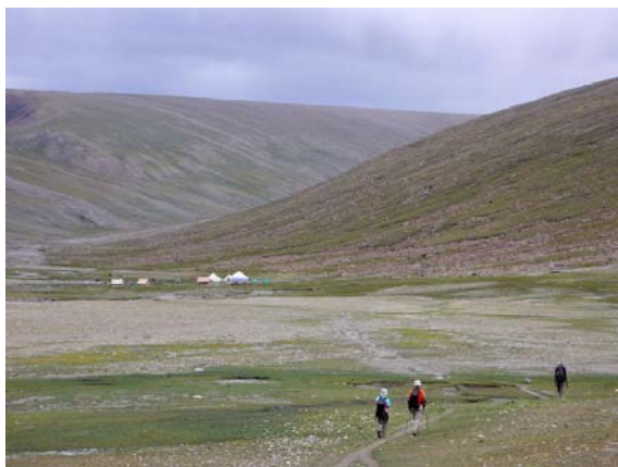
Arribant a Nimaling, 4.720 m

Ens dirigim a la capçalera de la vall, l'espai es va obrint i l'horitzó s'eixampla. Tots els pics que ens rodegen ultrapassen els 5.000 metres, encara que el límit inferior de les neus perpètues sembla estar pels 5.500 m. Portem unes tres hores quan arribem a una llacuna rodejada de vaques peludes que semblen iaks. Un parapet circular de pedra ens defensa del vent i serveix per seure una estona i gaudir de la visió més propera de la gran massa nevada del Kang Yatze i tota la serralada que l'acompanya. D'aquí surt el sender que s'atansa al campament base dels que volen escalar-lo. Arribar a l'avantcim per un llarg pendent nevad no sembla difícil. A continuació, una esmolada cresta d'aspecte ferotge barra els pas al cim principal.