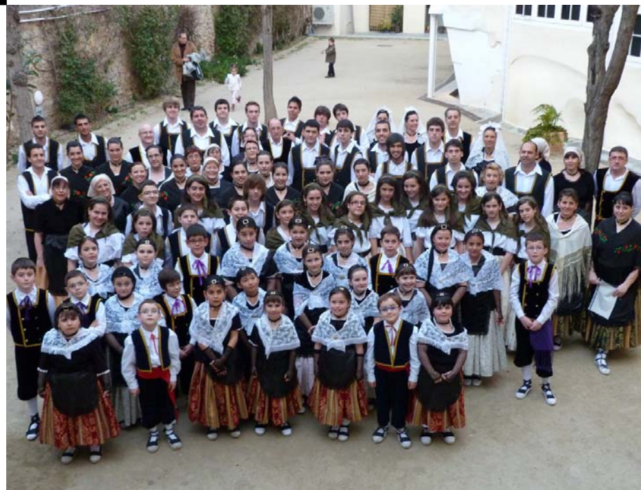
Components dels diferents grups que van participar en el festival d'aniversari al teatre Metropol

Esbart fundador de l'Agrupament d'Esbart Dansaires de Catalunya, de la "Federación Española de Asociaciones de Folklore" i de l'Agrupament d'Esbaris de les comarques tarragonines.