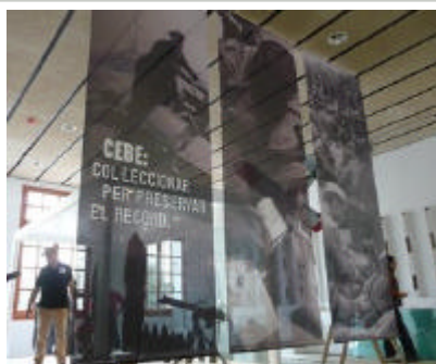
Els operaris estaven acabant de muntar ahir al matí el renovat centre d'interpretació de Gandesa.