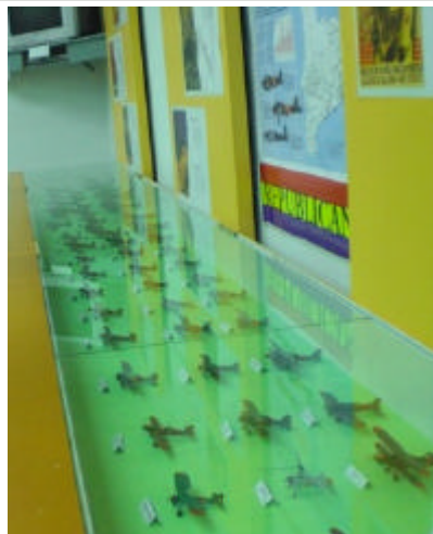
Una de les vitrines de l'exposició permanent del Cebe.