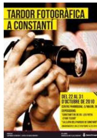
Tardor Fotogràfica Cartell de la segona edició de la Tardor Fotogràfica