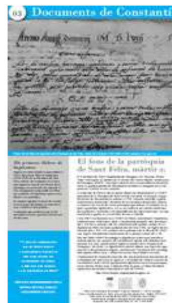
Documents de Constantí Número monogràfic dedicat al fons de la Parròquia de Sant Feliu dipositat de l'Arxiu Arxidiocesà de Tarragona.

D'altra banda, el tercer número del quadríptic dels "Documents de Constantí" és un monogràfic per a la difusió del Fons de la Parròquia de Sant Feliu dipositat a l'Arxiu Històric Arxidiocesà de Tarragona (AHAT). Conté una explicació de la història arxivística d'aquest fons, del projecte per a la seva digitalització en curs de realització i una selecció i comentari d'algunes imatges curioses d'aquests documents. L'autoria del text ha correspost al tècnic de l'AHAT, Joan M. Quijada.