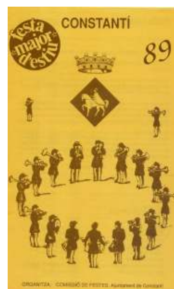
Festa Major d'Estiu (1989) Portada del programa d'actes