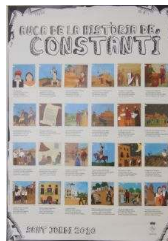
Auca de la Història de Constantí

Una última actuació i, potser la més divertida i original, va ser l'auca sobre la Història de Constantí dissenyada per l'empresa de comunicació Rambla Digital. Consta d'una làmina amb 24 rodolins relatius als principals fets de la història del municipi, des dels seus orígens prehistòrics fins al fenomen actual de la globalització. A sobre de cada rodolí calia enganxar-hi els 24 cromos adhesius amb la il·lustració corresponent a aquests mateixos fets. La làmina es va presentar davant d'un nombrós grup de nens i nenes de les escoles locals i es va repartir durant la Setmana de la Cultura i la Salut, per la diada de Sant Jordi. Els cromos es va anar distribuint per les botigues del poble.