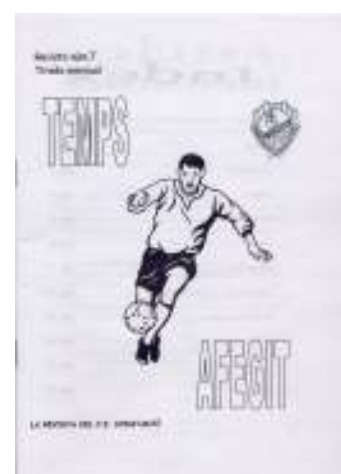
Temps afegit Portada del número 7 de la revista del C. E. Constantí

En segon lloc, s'ha descrit i instal·lat documentació de les regidories de l'Ajuntament corresponents a les àrees de cultura, ensenyament, festes, mediambient i esports dels anys 1975 a 1994. En total, són 226 unitats documentals que ocupen quatre metres de prestatgeria. Abans de la intervenció ocupava gairebé el doble d'espai, però després d'eliminar les fotocòpies de les lleis, els esborranys preparatoris i la publicitat que no formava part de cap procediment; i de treure les carpetes doblegades, els impresos buits i l'altre material sense interès s'ha aconseguit una considerable reducció d'espai.