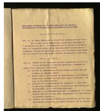
El Pla d'Ocupació de Digitalització

Primera pàgina del Reglament de la Junta Municipal de Sanitat (1926) (sign. 746).