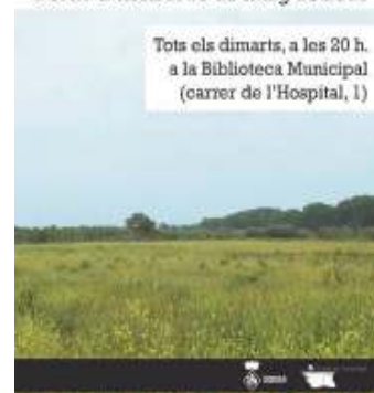
I Jornades sobre el paisatge de Constantí El cartell de les jornades, amb un cicle de xerrades sobre el terme municipal.