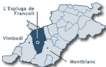
Comarca de la Conca de Barberà

L'Ateneu Republicà Federal Català de l'Espluga de Francolí es fundà el 1931 amb l'intent de preparar les candidatures a les eleccions del 12 d'abril. El mes de març varen redactar un manifest que resumia els seus propòsits i, aconseguida la victòria electoral republicana, el dia 14 Mació proclamava la República Catalana i els set regidors escollits es feren càrrec de les seves responsabilitats al municipi.