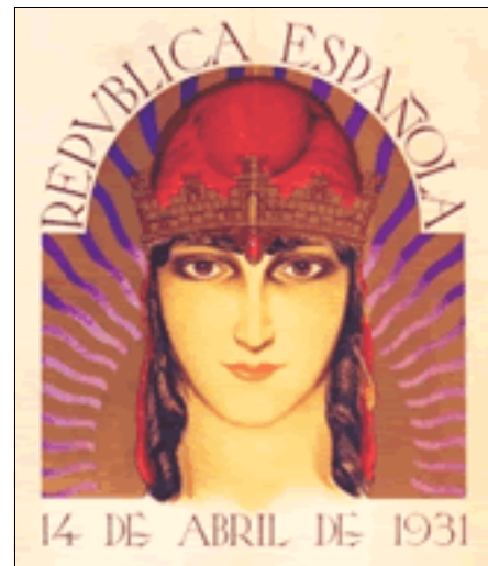
Al·legoria de la República

“L'eufòria es va desbordar en penjar la bandera republicana que durant tantes dècades havia guardat a la calaixera el vell Sisco de ca l'Agneta”