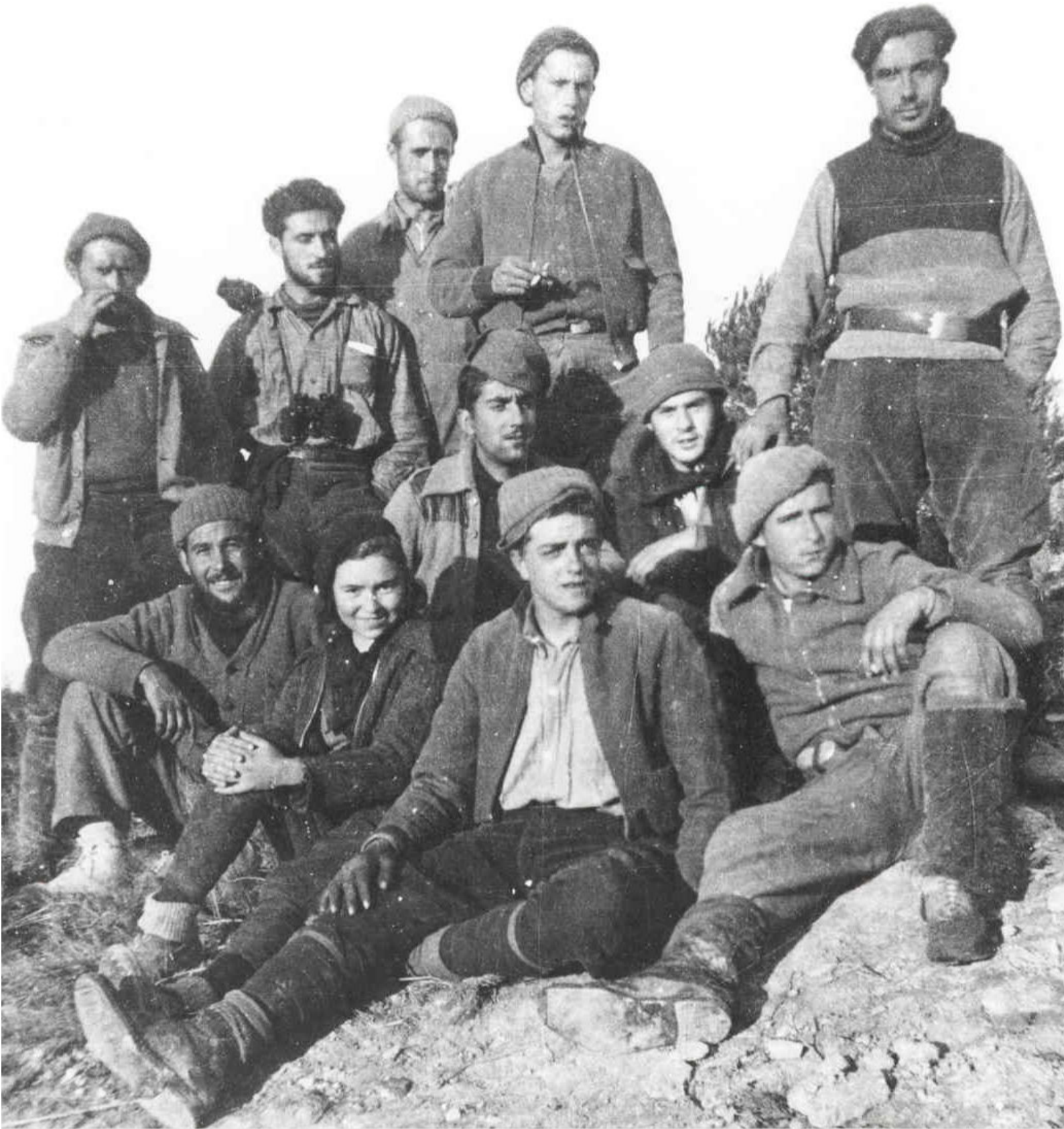
"Milicians de Constantí i Palafrugell" (1936).